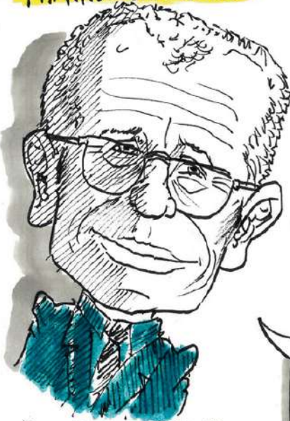
Jean-Philippe PIERRON Philosophe